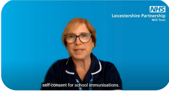
ہماری طبی رہنما رضامندی کی وضاحت کرتی ہیں tiny.cc/selfconsent

www.leicspart.nhs.uk/service/schoolagedimms یا آپ ذیل میں موجود یہ ویڈیوز ملاحظہ کر سکتے ہیں: